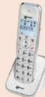
AMPLIDECT 295 AD

Le principal atout de cette gamme est qu'elle vous laisse la liberté de créer vos propres associations selon vos besoins