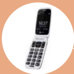
Téléphones p. 66-68