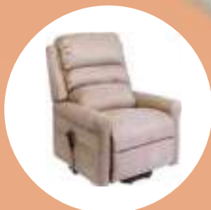
Fauteuils releveurs p. 58-65