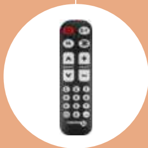
Télévision p. 68

Idéal pour les personnes souffrant de problèmes de dextérité grâce à ses larges touches.