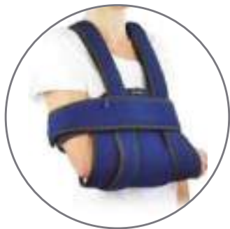
Gilet d'immobilisation d'épaule

Quel que soit votre problème, nos conseillers Capvital sont là pour trouver la solution adaptée !