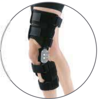
Attelle de genou