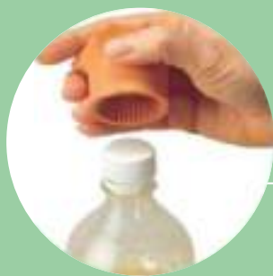
Ouvre-bouteille p. 74

Un ouvre-bouteille permet une prise facile et ferme sur les petits bouchons. Très utile pour les personnes ayant des problèmes ou douleurs de préhension.