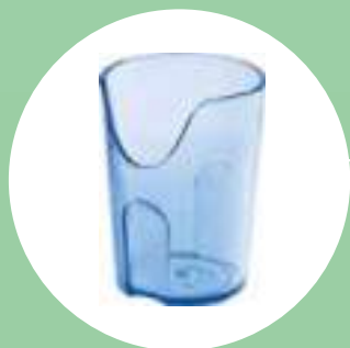
Verre à boire p. 73