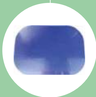
Tapis antidérapant p. 74

Ne colle pas et adhère des deux côtés pour empêcher tout mouvement.. Ces tapis antidérapants apportent soutien, stabilité et des repères visuels pour redonner confiance lors de vos tâches quotidiennes.